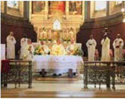
in Wien am 5. Juli