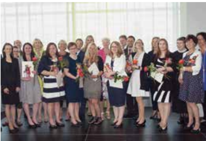
Foto Projektmesse