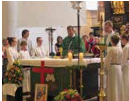
in Pettenbach am 5. Juli

Geriatriezentrums Am Wienerwald, wo er 25 Jahre gewirkt hat. Mit ihm konzelebrierten zahlreiche Mitbrüder und dankten Gott für sein priesterliches Wirken. Bei der anschließenden Agape im Klostergarten gab es regen Gedankenaustausch und gutes Essen.